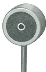
Fühler Typ 3002 Typ 3003

Alle Geräte in schlagfesten Kunststoffgehäusen