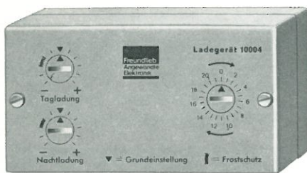
Ladegerät Typ 10004

Alle Geräte in schlagfesten Kunststoffgehäusen